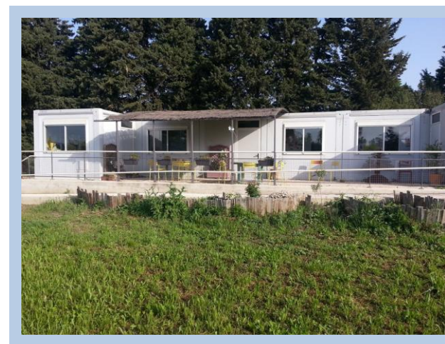
Service d'accueil de jour